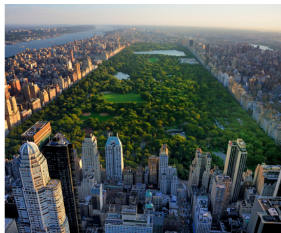
New York, Central Park