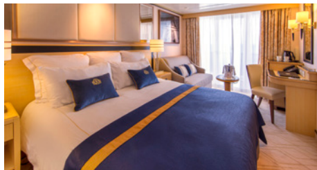
Cabine extérieure balcon, cat. BC