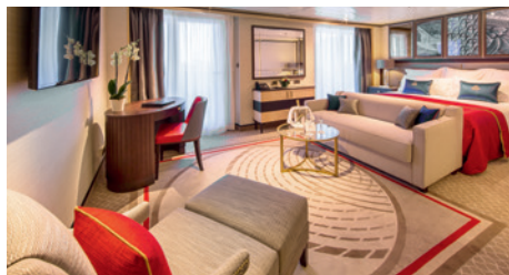
Suite Queens Grill balcon, cat. Q5