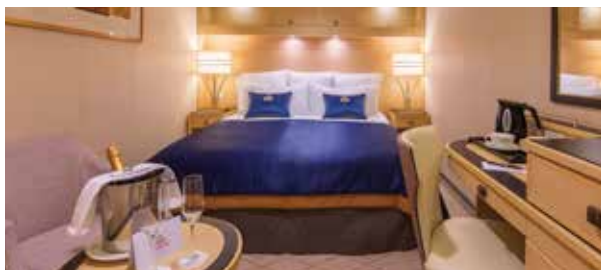
Cabines Intérieures HB, IA, IB, IE, IF Superficie approx. 15 m 2