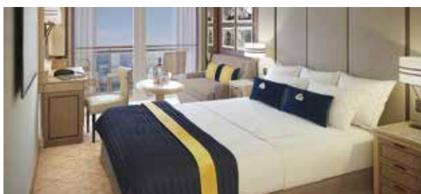
Cabines extérieures Luxe Balcon BB, BC, BF Cabines Club Balcon A1, A2 Superficie approx. 23 m 2