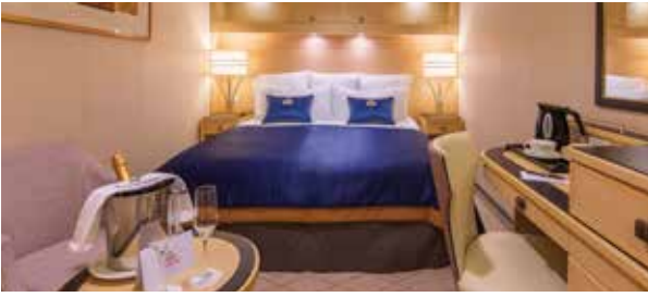
Cabines Intérieures HB, IA, IB, IE, IF Superficie approx. 15 m 2