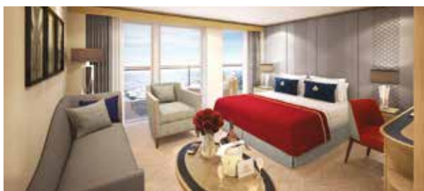
Mini-suite balcon P1, P2 Superficie approx. 35 m 2