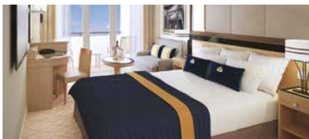
Cabines extérieures balcon loggia BU, BV, BY, BZ Superficie approx. 25 m 2