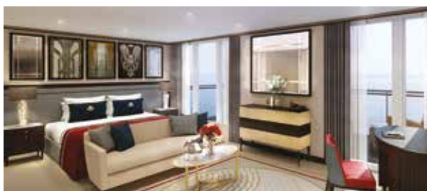
Suite balcon Q5, Q6, Q7 Superficie approx. 47 m 2