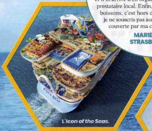
L'Icon of the Seas.