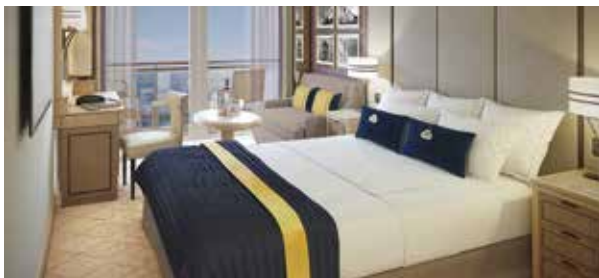
Cabines extérieures Luxe Balcon BB, BC, BF Cabines Club Balcon A1, A2 Superficie approx. 23 m 2